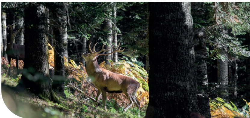
Cerf et biche en Vallée d'Aure