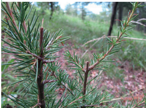
Abrouitissement sur Cèdre de l'Atlas

Le signalement des dégâts est la première étape vers la restauration de l'équilibre forêt-gibier et la réussite des renouvellements forestiers. Récolter des données mutualisées, fiables et précises est nécessaire pour identifier les zones en déséquilibre et les actions correctrices à mettre en place.