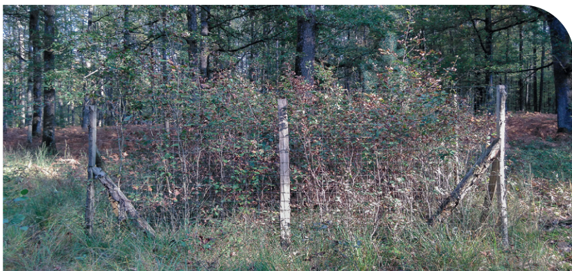
Enclos témoin : observation de la régénération hors de portée du gibier

Source : Ministère de la transition écologique et de la cohésion des territoires (décembre 2022). Les ongulés sauvages de France métropolitaine, fonctions écologiques, services écosystémiques et contraintes.