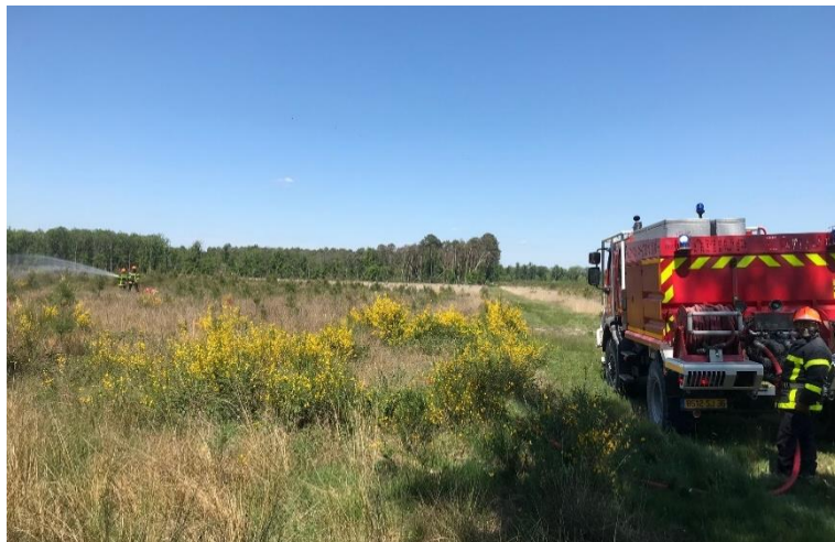
Manoeuvre du SDIS en forêt de Lancosme le 10 mai 2022

La première partie de la journée a été consacrée à une table ronde au cours de laquelle sont intervenus la DDT 36, la DDT 37 et le Service Départemental d'Incendie et de Secours de l'Indre (SDIS 36). Les différents intervenants ont pu présenter : les risques d'incendie en forêt en région Centre Val de Loire, l'organisation du SDIS et des interventions en forêt, les types d'accès et les caractéristiques des points d'eau en forêt, l'Atlas régional du risque de feux de forêts ( disponible sur le site internet de la DREAL Centre Val de Loire ), les deux arrêtés préfectoraux « brûlage » ( disponibles sur le site internet de la DDT 36, arrêtés n°36-2021-01-21-0002 et n°36-2021-05-26-00002 ), des conseils en gestion forestière et des bonnes pratiques à appliquer pour prévenir les incendies et faciliter les accès en cas d'incendie dans sa propriété.