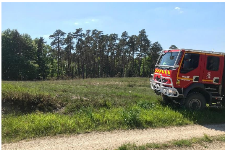
Démonstration du SDIS en forêt de Lancosme le 10 mai 2022

Le 10 mai dernier avait lieu la réunion « prévenir les incendies de forêt et lutter contre leur propagation » organisée par le CETEF de l'Indre et le CNPF.