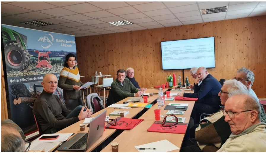
Un conseil d'administration à Fransylva 26- aux Etablissement ASTIC, Pont de l'Isère