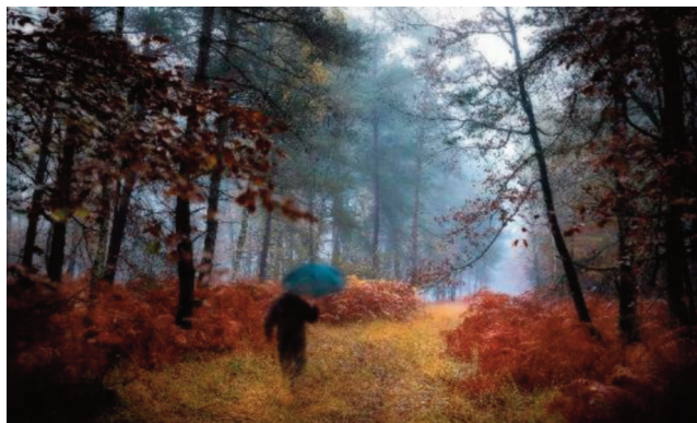
Concours National FRANSYLVA

D'après certains sylviculteurs, nous ne devrions pas parler d'arbres mais seulement de bois, de forêts, etc..